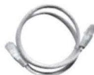
1 x Ethernet-kaabel